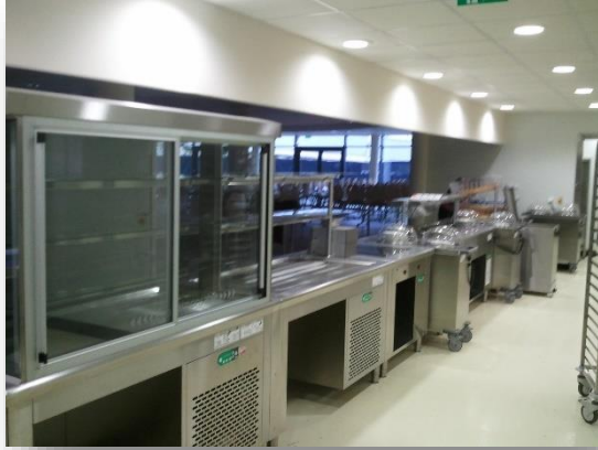
Collège Chatillon sur Loire