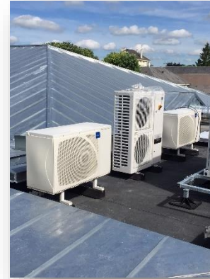
Cuisine centrale Sermaises 2017 (400k€)